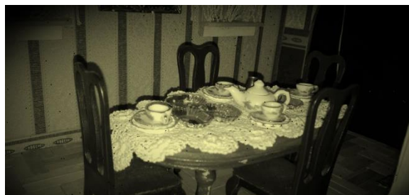
Zastawa złożona z talerzyków o średnicy 1 cm i miniaturowych filiżanek