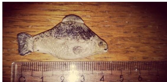
Świąteczny karp dla lalek