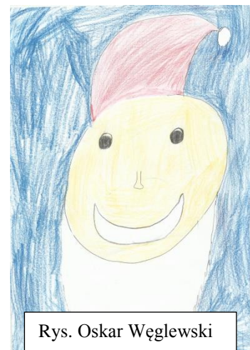
Rys. Oskar Węglewski

Ostatni tydzień przed świętami, czas, który powinniśmy spędzić na przygotowaniu się do narodzin Jezusa, godzeniu się i byciu dla siebie miłym, upływa na nieustannych kłótniach, wrzaskach oraz płaczu. W tym miejscu nasuwa się pytanie: Czy obchodzenie Świąt Bożego Narodzenia jest potrzebne?