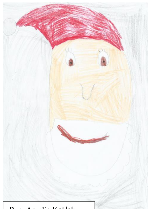
Rys. Amelia Królak