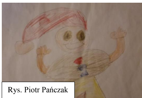
Rys. Piotr Pańczak

Jest coraz zimniej, drzewa zrzuciły liście, a zwierzęta śpią w swoich norkach. Jednym słowem... przyroda przygotowuje się do nadchodzącej zimy.