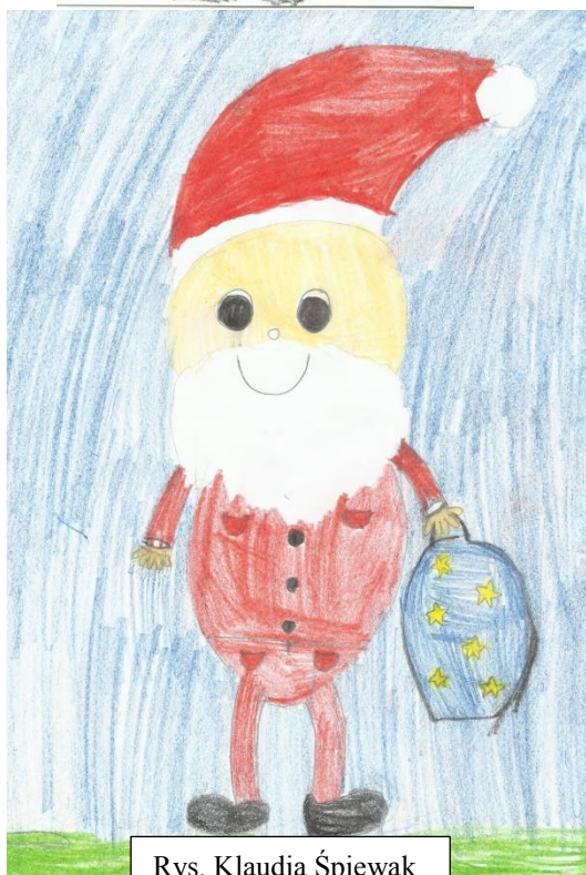
Rys. Klaudia Śpiewak