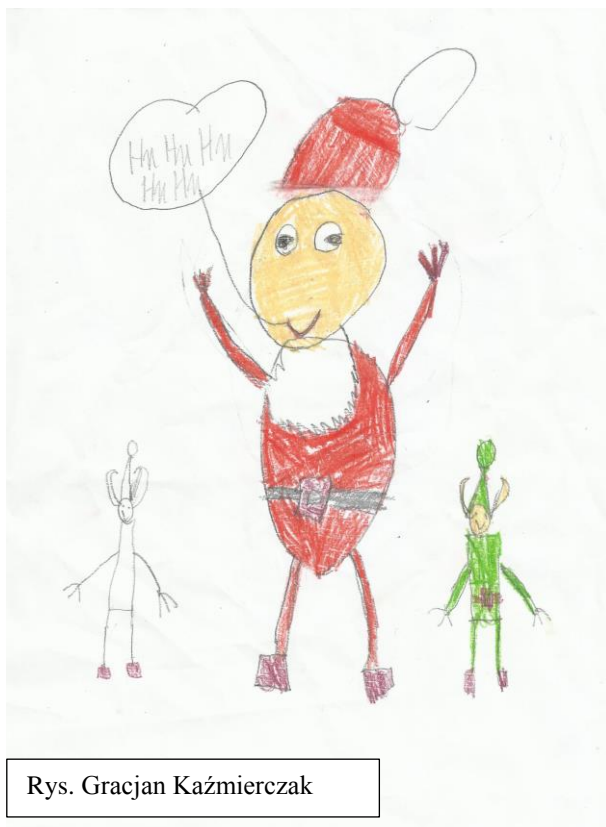
Rys. Gracjan Kaźmierczak