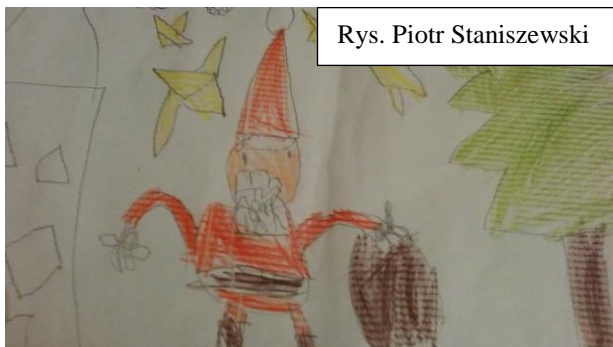
Rys. Piotr Staniszewski

piszą listy. Rodzice, widząc zaangażowanie, chcą uszczęśliwić swoje pociechy. Ruszają zatem do centrum handlowego i... dają się złapać w pułapkę! Właściciele sklepów czekają tylko na poszukiwaczy prezentów. Wobec tego przeprowadzają promocje, obniżają ceny, dekorują wystawy, wszystko,