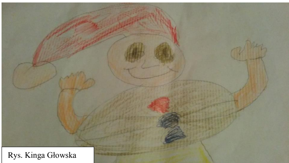
Rys. Kinga Głowska